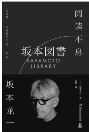
湖南文艺出版社 译者:白荷