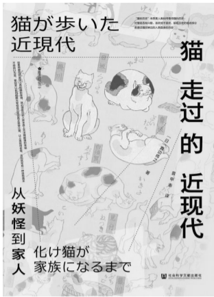
日真达将之著作 申幸译