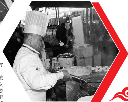
现场展示盐城建湖的藕粉圆子制作手艺