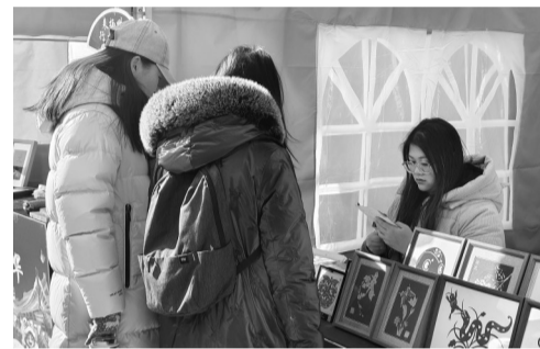
市民、旅客看年货

现代快报讯（通讯员 沈晨 记者 顾潇）1月10日上午，随着一声锣响，“我的扬州你的家欢欢喜喜过大年”——2025年扬州非遗年货嘉年华系列活动在扬州东站广场正式开街。22项非遗产品和多项特色年货集中销售，喜庆的展位呈纵队排列，浓烈的节日氛围扑面而来。