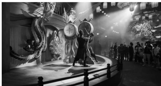
沉浸式多维空间剧《只此周庄》

活动现场，推出了春节期间“跟着演出去旅行”系列活动。整个春节假期，全省范围内将举办379场演出活动。