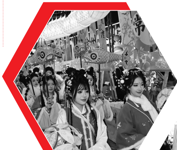
活动现场的非遗市集

记者了解到，此次非遗年货嘉年华活动将持续至1月20日结束，让广大旅客现场感受非遗老字号的独特魅力、传统文化的独具匠心，让新扬州人“带非遗好物回家过年”，将满满的好运和吉祥带回家。