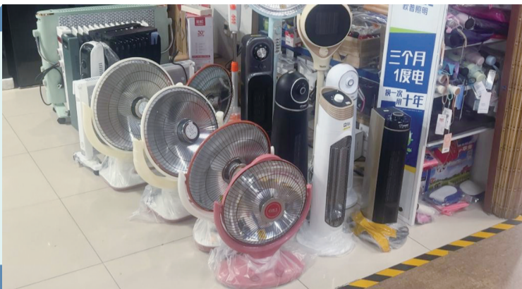
市场常见的取暖神器