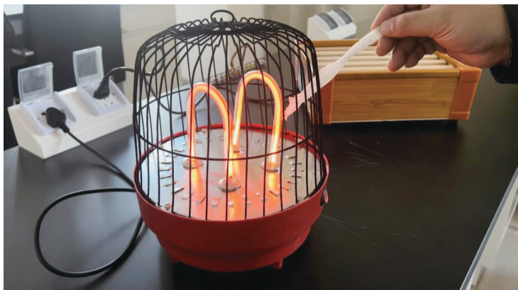
专家对“鸟笼取暖器”进行安全测试