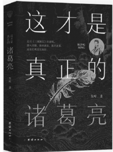
《这才是真正的诸葛亮》 朱晖 著 团结出版社 2025年2月

正如朱晖所总结的那样,是人就会犯错误,诸葛亮自然也不能例外。但诸葛亮的不同之处在于他的人生态度:只要认准一件事,就永远打不垮,吓不倒,干到底。尽管诸葛亮明知季汉无法对抗曹魏,尽管诸葛亮接手的是一个充满内忧外患的烂摊子,但他不屈不挠,意志坚定;无论成败,至死方休——一个孤绝的灵魂,一次孤绝的奋斗,一路悲壮的逆行,“这,才是一个更加真实的诸葛亮形象”。