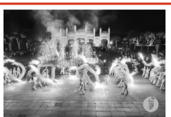
舞龙嘘花火热上演