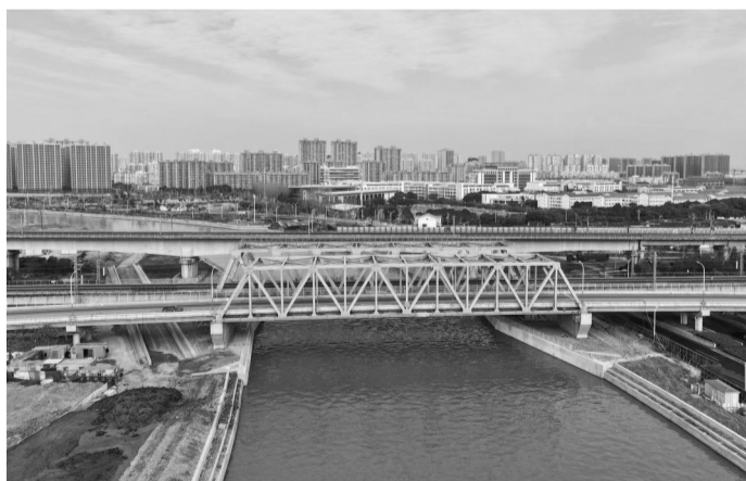
“平地开河”航道

此前,由于水运需求增长迅猛、船舶大型化趋势加快,锡澄运河原有的五级航道标准远不能满足现实需要,狭窄的河面上船舶时常拥堵,低矮的桥梁容易被大船碰撞。为消除隐患,交通港航部门集聚各方力量,联合推进锡澄运河五级改三级航道整治工程。本次竣工的锡澄运河无锡市区段航道整治工程是全线贯通的关键节点,该项目于2014年5月开工,工程整治范围起于锡澄运河平地开挖航道与京杭运河交界处,止于锡澄运河惠山、江阴交界处,按三级航道标准整治航道12.75公里(其中1.9公里为平地开河改线段),主要建设内容为新建驳岸18061米;建设黄石大桥、杨家圩大桥和石幢桥3座公路桥梁;改建151号铁路桥(京沪铁路无锡北至无锡段6.1公里);配套布置水上服务区1处,建设标志标牌、