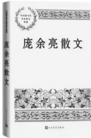
《庞余亮散文》 庞余亮 人民文学出版社 2024年9月