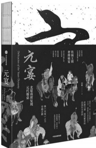
《元宴》 徐鲤 中信出版社 2024年8月

徐鲤继《宋宴》之后,又推出一本记录一个朝代美食文化的新作——《元宴》。从青虾卷裹的清新雅致,到蟹羹冷盘的鲜美开胃,再到锅烧肉的酥脆多汁。印象中,元代是一个兴之于马背的铁骑王朝,总以为只有风雅诗意的宋代才会吃那些精致繁复的美食,没想到看似粗豪的元代也在餐桌上吃出了别样滋味。看来,元代人不仅能吃,更会吃。