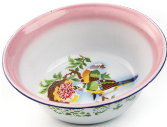
兰州工字牌搪瓷面盆