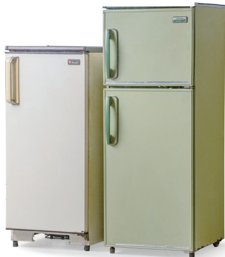
双鹿牌单双门冰箱