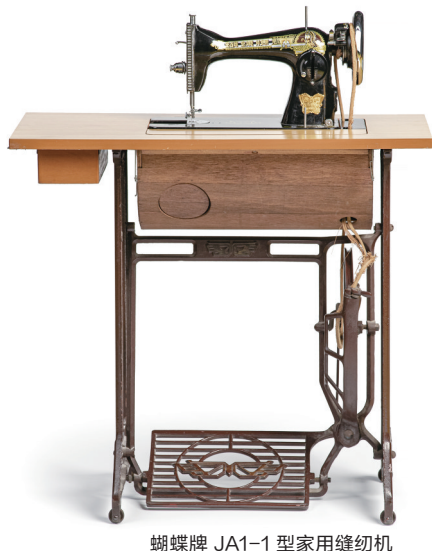
蝴蝶牌 JA1-1 型家用缝纫机