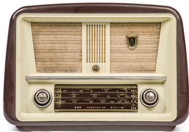
熊猫牌 601-1 型收音机