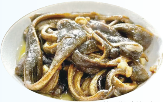
鳝鱼 快报资料图片