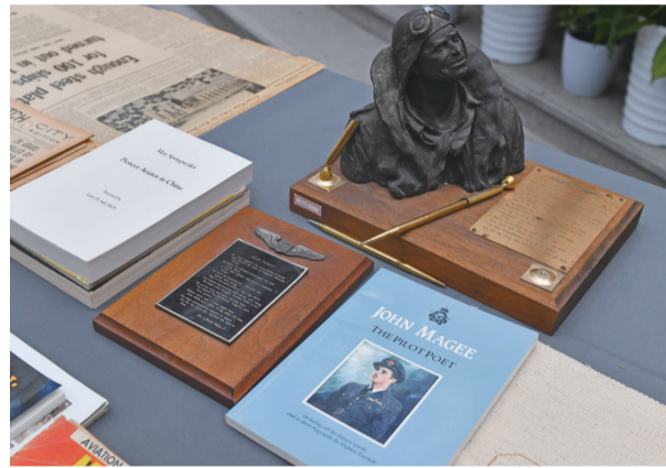
与小约翰·吉利斯比·马吉相关的史料