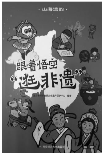
南京师范大学出版社 连云港市非物质文化遗产保护中心 编著 《山海遗韵——跟着悟空“逛非遗”》 2024年4月

最近，《山海遗韵——跟着悟空“逛非遗”》一书出版发行。该书选取50个具有一定影响力的连云港市非遗代表性项目，按流布地域进行分类，共设九个站点，每个站点把此地域内的重点非遗项目串联成线，由“悟空”导览逐一讲述。书内详细介绍所列重点非遗项目的历史背景、趣闻故事、技艺解读、民俗习惯、制作流程以及流布区域等，同时，还专门为青少年读者开设了拓展实践与链接贴士专栏，既注重非遗的传承，又举一反三地扩展了非遗项目的知识面。该书内容活泼，文字生动，图文并茂，知识性、趣味性，是一本难得的介绍地方非遗的普及读物和青少年的校本教材。