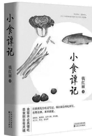
百花文艺出版社 2024年4月 钱红丽 著 《小食谭记》

作为与钱红丽相识二十多年的老乡兼笔友，我亲眼见证了她在文字领域的华丽蜕变与稳健成长。从早年笔触的青涩，到如今文字的成熟与深邃，她的作品广受各大报刊青睐，专栏频开，散文集更是接连出版，广受读者好评。近期，我有幸沉浸于她精心烹制的美食随笔集《小食谭记》，书中文字犹如佳肴般令人垂涎，堪称人间至味。