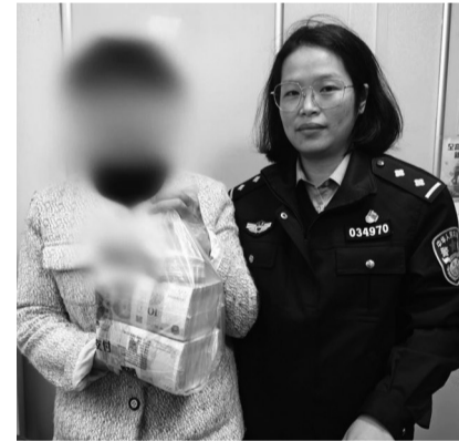
差点被骗走的黄金和现金 民警发现及时,成功挽损35万