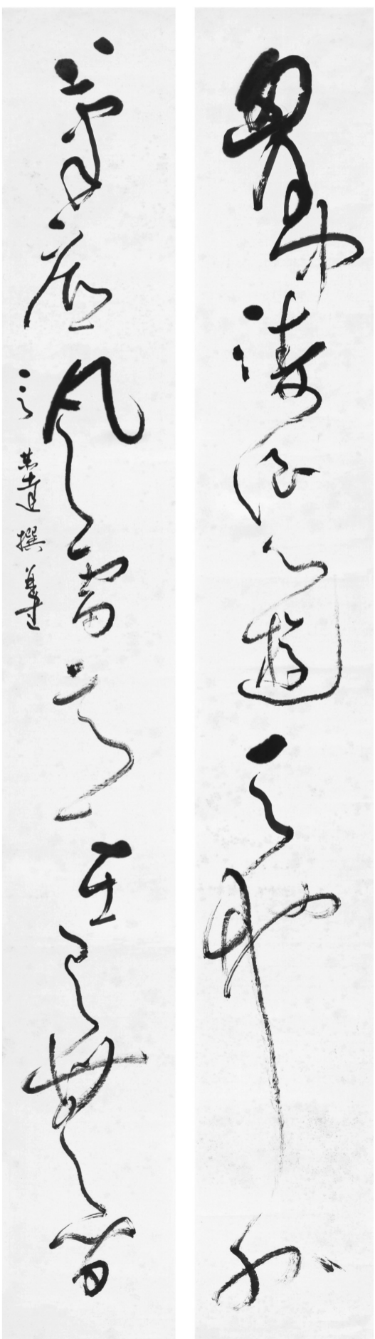
书本图片由现代快报/现代+记者 牛华新 摄