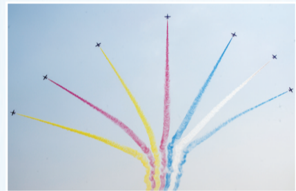
中国“红鹰”飞行表演队进行飞行表演