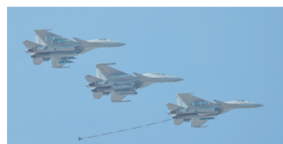
航展上,海军歼-15系列舰载战斗机编队展示伙伴加油课目

海军1架歼-15D、2架歼-15T战机进行的伙伴加油飞行课目表演引起广泛关注。伙伴加油是指飞机为同型或近似型号的飞机进行空中加油增加航程。“伙伴加油对舰载航空兵来说极具实战价值,是舰载机战力的倍增器。”军事专家曹卫东介绍,在起飞重量一定的条件下,舰载机载弹量和燃油携带量是矛盾的,伙伴加油能让舰载机起飞时挂载更多弹药,升空后再进行油料补充。比如大型加油机执行任务时,需要由其他飞机进行护航,而伙伴加油机本身是保留了战斗力的,面对突发情况,可以抛掉加油吊舱投入战斗。