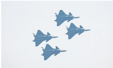
空军歼-20 战机四机编队飞行展示