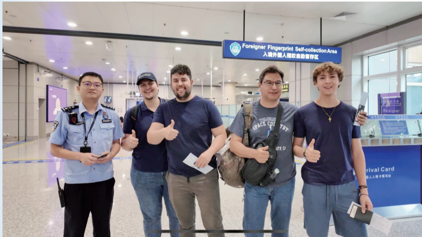
暑运出境出行火热