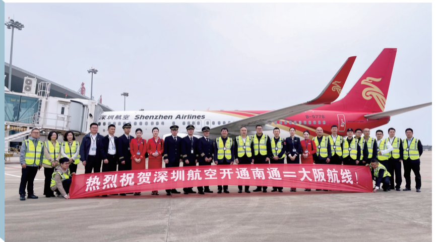
10月27日,南通直飞日本大阪的航线正式复航