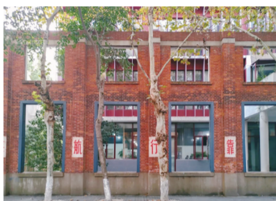
如今的南京第二机床厂

南京第二机床厂入选第六批国家工业遗产的核心物项包括八号楼(原铸造车间),十九号楼(原工模具车间),二十六号、二十七号、二十八号连跨楼(大件车间);回转式除尘器,龙门吊及露天行架、回火炉等生产设备,Y5120B插齿机、JN-