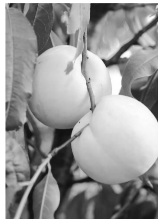
雪桃挂枝头

据了解,雪桃的生长周期很长,从3月开花到10月份果实开始成熟,其间的管理难度非常大。记者在现场看到,雪桃果型较大,平均单果重量约为400克,最大单果重量可达600克。成熟的雪桃果实呈圆形,顶部有短尖角,整体果型端庄整齐,其表面呈现出白色略带微黄色泽,口感清脆,肉质细腻,甜度