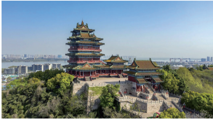
阅江楼景区