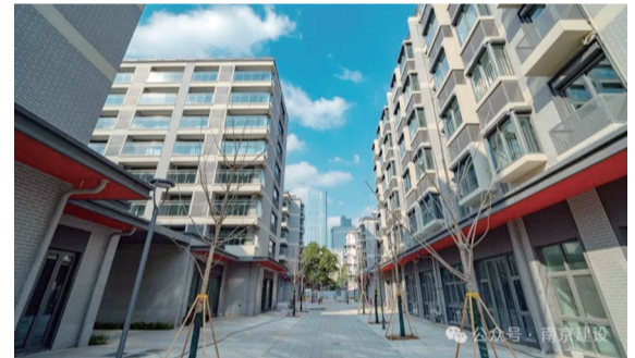
重建后的石榴新村