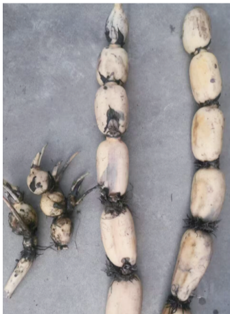
畸形莲藕与正常莲藕对比

报记者说:“现在厂方提出的处理方案是,每亩赔偿1000多元,而根据当时的市场行情,平均亩产莲藕4000斤一亩,市场平均单价2.8元一斤,我的直接损失每亩就在11200元。后期,我还要清塘、翻土、消毒、灭菌,重新种植藕苗,这些花费都还没算上。现在差距太大了,这个我肯定接受不了。”