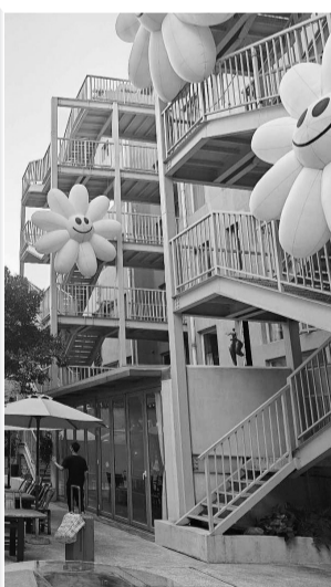
利济巷“小而美”的特色商业街区

夫子庙再现拉链式人墙,红山森林动物园购票及预约已达上限,中山陵音乐台的鸽子都没地方落脚了……国庆假期,南京的旅游热度一路高涨,有不少网友在线请教“在南京游玩怎么避开人流”。那么,不妨复制这条 Citywalk 路线,打卡利济巷一科巷一西白菜园历史风貌区。