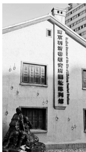
南京利济巷慰安所旧址陈列馆