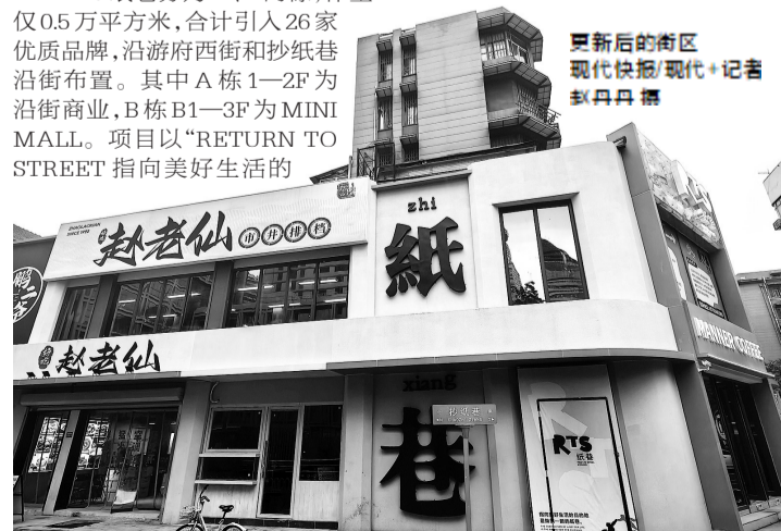
更新后的街区

作为南京城市微更新系列项目,“小而美”的RTS纸巷为新街口、秦淮区乃至整个南京提供了全新的消费体验空间。