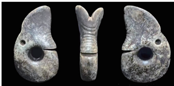
元宝山积石冢遗址出土的玉龙