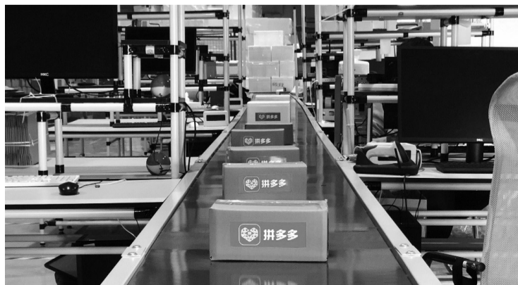
拼多多正推动“多实惠”与“好服务”向偏远地区加大供给

“小电商大市场,电商平台可以成为内需消费经济的重要推动力。”徐勇表示,电商平台是电商商家及货源信息、资金流和快递物流的HUB集散地,具有很强的导向功能。“拼多多充分发挥平台的导向作用,牺牲一部分自身利益,但理顺了自己与消费者、电商以及快递物流的‘四者关系’,推动了中西部偏远地区消费者、电商平台以及快递物流的共赢发展。”