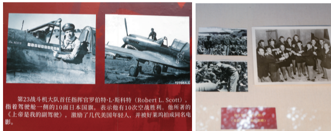
第23战斗机大队首任指挥官罗伯特·L·斯科特(Robert L. Scott),指着驾驶舱一侧的10面日本国旗,表示他有10次空战胜利。他所著的《上帝是我的副驾驶》,激励了几代美国年轻人,并被好莱坞拍成同名电影。