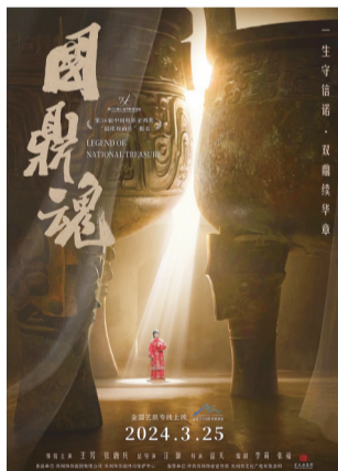
戏改电影《新龙门客栈》《淇国夫人》《国鼎魂》官方海报