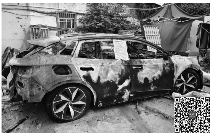
发生自燃的淹水车 扫码看视频

前不久，南京江宁发生了一起新能源汽车火灾。一家修车厂内，一辆正在维修的新能源汽车突然起火，所幸未造成人员伤亡，仅导致车损。后消防部门调查发现，这辆车是一辆淹过水的二手车，保险公司认定为淹水五级，也就是说车辆几乎整车淹水，而这也是火灾发生的原因。