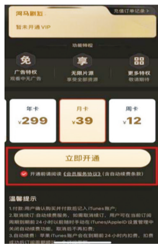
河马剧场App充值截图