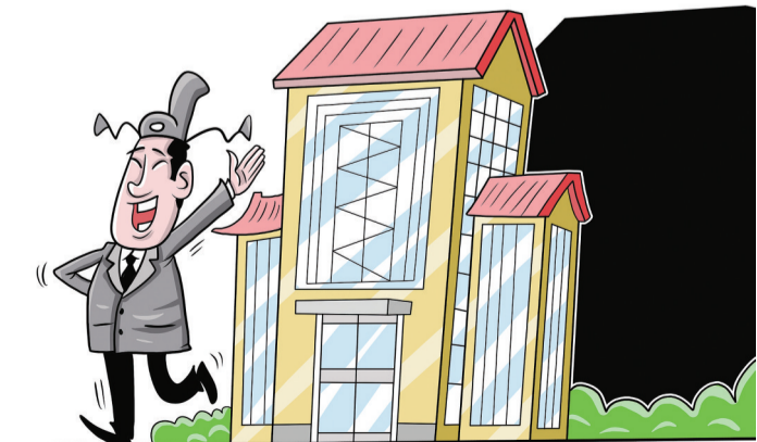
多地发文揭批“新形象工程”

金杯银杯不如百姓口碑。用实干的业绩、民意的尺子来丈量“政绩”，百姓自会看在眼里、赞在口中。新修订的《中国共产党纪律处分条例》在总则中，新增对党组织和党员“切实履行正确的权力观、政绩观、事业观”的要求。在分则中，新增第五十七条，充实党员领导干部政绩观错位，违背新发展理念、背离高质量发展要求的处分规定，将搞劳民伤财的“形象工程”“政绩工程”行为由违反群众纪律调整到违反政治纪律，并规定为重或者加重处分情形。