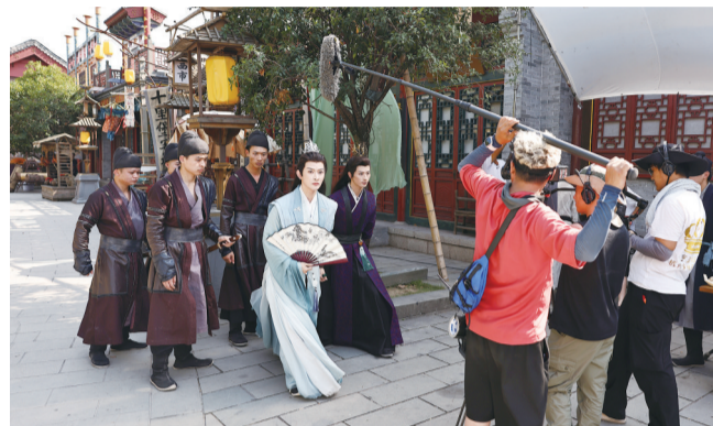
8月25日，浙江金华，东阳市横店影视城华夏文化园景区内，一部古装微短剧正在有条不紊地拍摄

针对老年消费者，省消保委建议平台开通老年人付费模式，解决数字困难群体冲动消费难题，可以通过多次提醒、大字或显著标识进行告知以及设置付费上限等方式，建立老年人防沉迷模式，保障老年消费者在享受数字化带来便捷的同时，也能够安心、放心消费，降低冲动消费带来的风险。