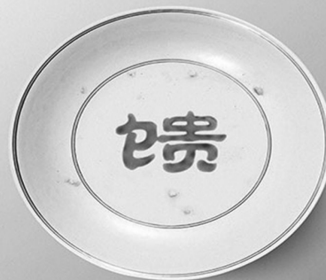
大地馈赠 拒绝浪费