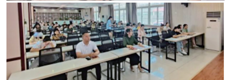
建院附小期末总结大会