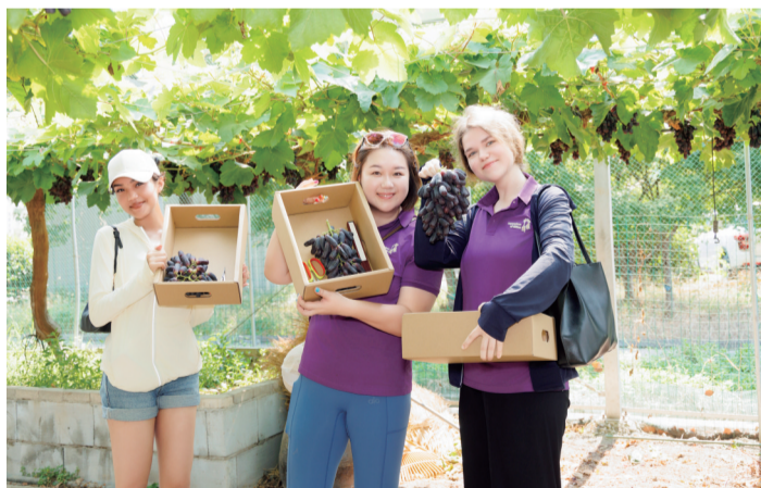
葡萄采摘体验

惠山高新区(洛社镇)运河文脉赓续千年,文化传承源远流长,农文旅融合发展,锡西风光带如诗如画,畅联国际链接世界,交通优势得天独厚。据悉,采风团在这里开展为期三天的实地采风拍摄活动。活动当天,惠山高新区(洛社镇)为采风团举行了欢迎仪式,讲述洛社的发展历史与运河文化的渊源,随后采风团成员观看百年非遗“凤羽龙”表演,学习舞龙技巧,体验舞龙活动,沉浸式感受扎染工艺,并参观运河文化公园B馆。夜里,在尚田文旅景区,音乐啤酒节以最大的热情、最动感的节奏,让