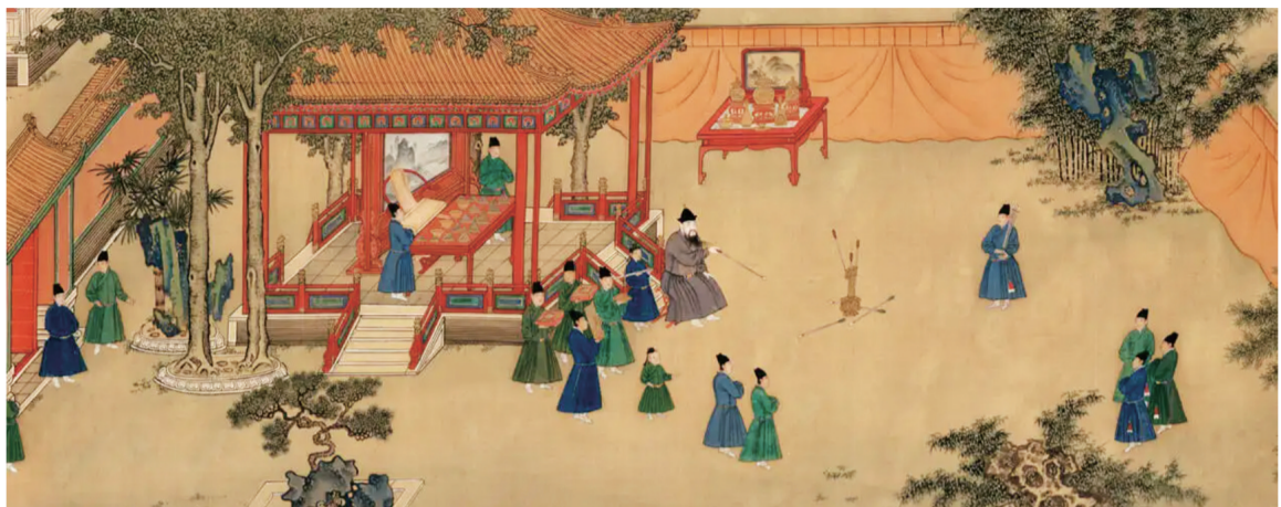
明 佚名《朱瞻基行乐图》(局部) 故宫博物院藏