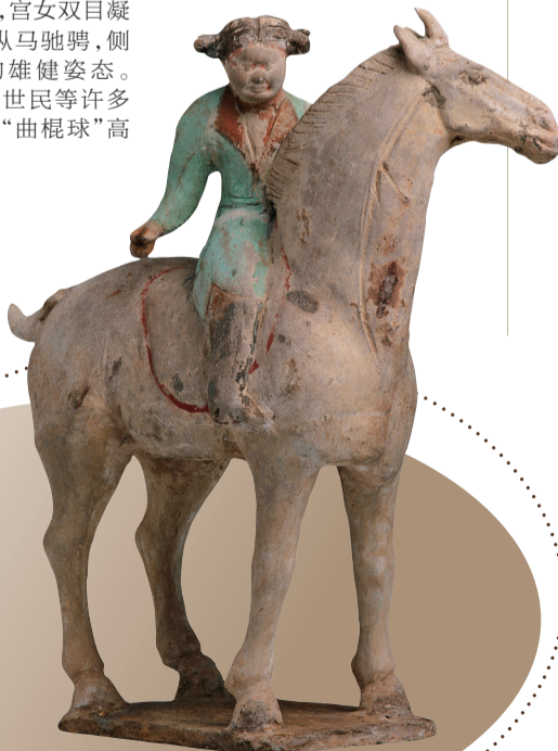
彩绘陶打马球女俑 唐(公元618年-907年) 中国国家博物馆藏

唐代留存至今的打球女俑,宫女双目凝神注视,纵马驰骋,侧身俯击的雄健姿态。唐太宗李世民等许多帝王都是“曲棍球”高手。