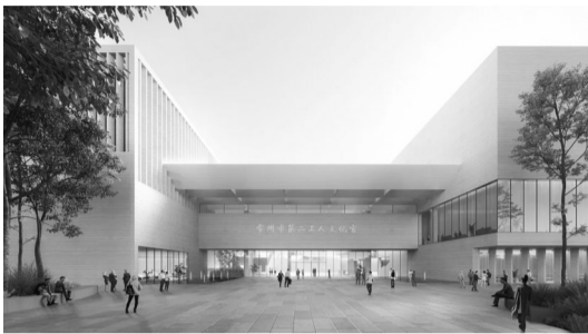
东侧主入口广场效果图

现代快报讯(通讯员 吴文龙 记者 陈云龙)7月30日上午,常州市第二工人文化宫项目开工仪式在新北区新桥街道举行。该项目位于常州高铁新城核心区,总投资6亿元,总建筑面积约6.4万平方米,预计2026年12月份竣工。