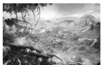
异星探秘