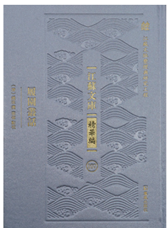
《江苏文库·精华编》之《履园丛话》