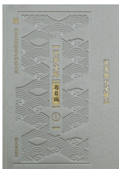
《江苏文库·书目编》之《江苏地方文献志》