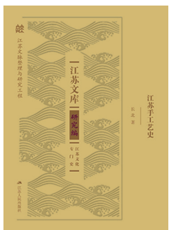
《江苏文库·研究编》之《江苏手工艺史》