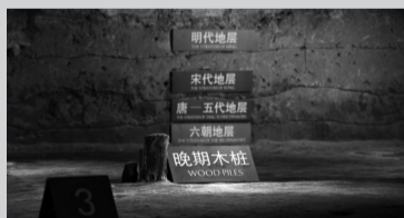
六朝博物馆负一楼遗址厅，是整座博物馆的“根基”