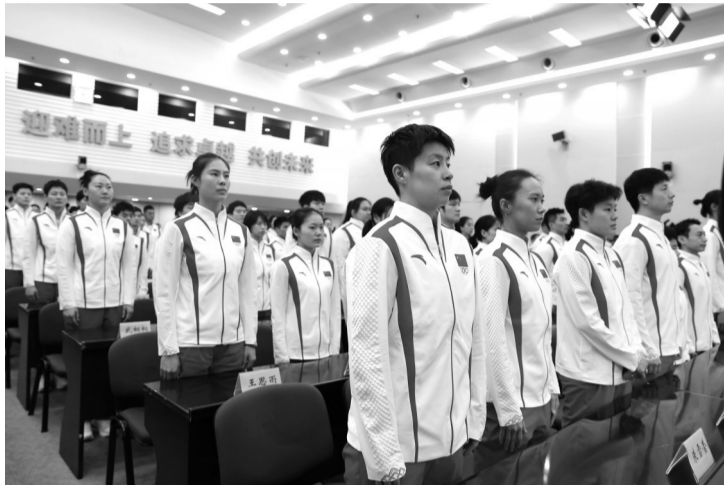
中国体育代表团精锐尽出

13日,巴黎奥运会中国体育代表团在北京成立,代表团总人数为716人,其中运动员405人。