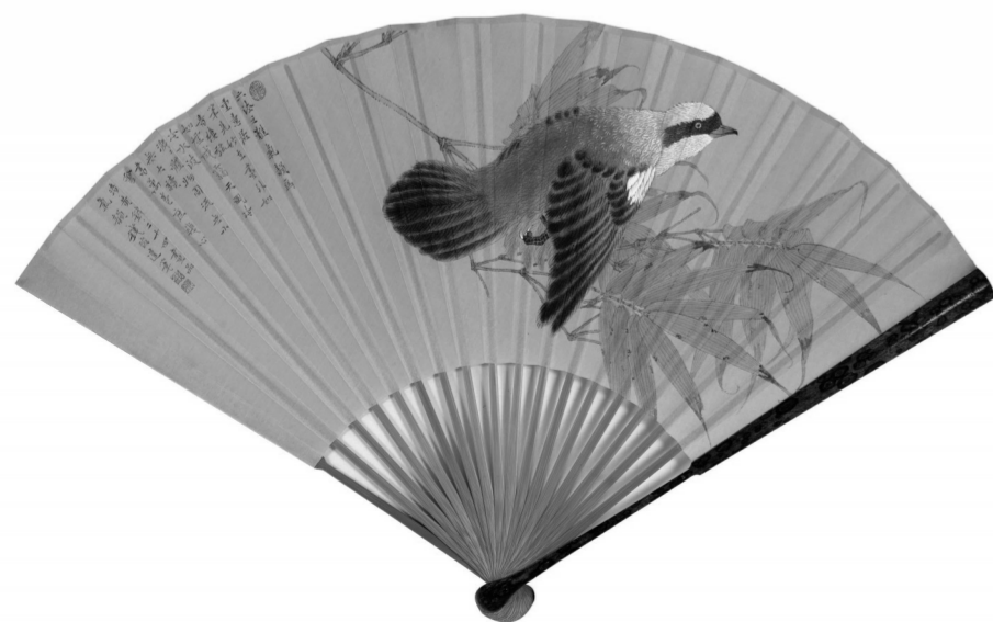
本版绘画均为钱俊达作品

现为:中国工笔画学会会员,江苏省花鸟画研究会理事,江苏省文联书画研究中心研究员,江苏省美术家协会会员,江苏省书法家协会会员,南京市政协特聘画家,南京师范大学特聘教师,江苏省青年书法家协会会员,南京市青年美术家协会理事。