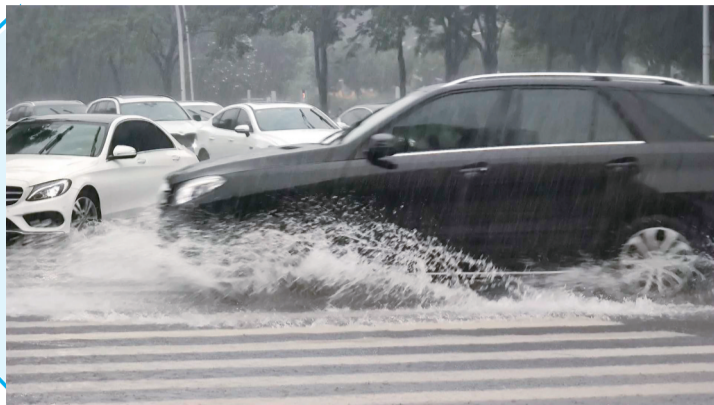
大雨中行车，溅起水花