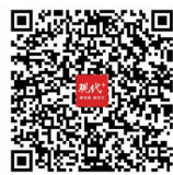
扫码查看22个纳凉点详细地址

现代快报记者从南京市国防动员办公室了解到,人防纳凉点内温度一般在22℃至24℃。市民应注意随内外温差增减衣物,以免感冒。建议患有风湿病的老人、体弱病人、孕妇婴儿谨慎入内。纳凉时间不宜过长,最好每隔1~2小时到洞外呼吸新鲜空气。