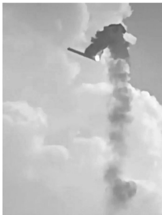
当地村民近距离拍摄的画面

记者从多名知情人士处获悉，该事故涉及的火箭为天兵科技公司天龙三号首飞箭，试车部分为该火箭的一级。天兵科技官网显示，天龙三号火箭是国内商业航天首款大型液体运载火箭，该火箭采用二级构型设计，以液氧和煤油作为主推进剂，该火箭按计