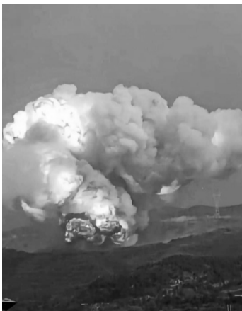
火箭坠地后起火

划将于2024年7月完成首飞任务，并在首飞后的三年内具备每年超过30次的商业发射能力。