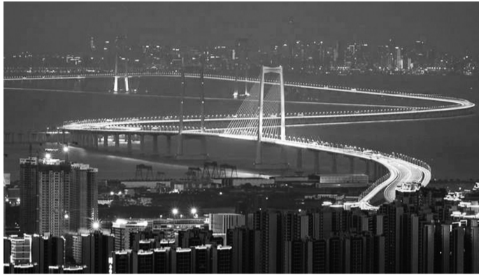
6月19日，即将通车的深中通道夜景

自建设以来，深中通道获得发明专利200余项、行业协会奖项数十项，并屡获国际赞誉。2024年4月，深中大桥荣获被称为桥梁界“诺贝尔奖”的国际桥梁大会“乔治·理查德森奖”，深中隧道荣膺