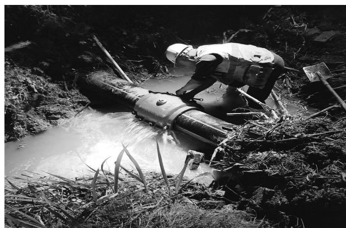
连云港赣榆民生水务工作人员在抢修供水管道

“入夏以来,报修电话比平时增加一倍还多,为了能让用户及时用上水,工友们顶着烈日上。”在塔山镇土城片区施工现场,维修工们正在放置预埋管道,全身已被汗水浸湿,汗与土的“结合”使好多工人成了“大花脸”。没擦一会儿,毛巾就能拧出水。“夏天管道被晒得发