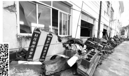
学校周边用竹竿和红绳围起来充当警戒线