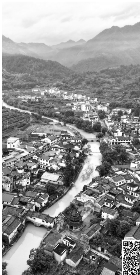
航拍安徽歙县降雨量最大的许村镇

6月20日,安徽省黄山市歙县遭遇强降水,多处被淹,部分区域灾情严重。21日,随着降雨的停止,积水很快退去。6月22日,现代快报记者来到歙县本轮降雨量最大的许村镇,洪水已经退去,当地正在清淤消杀。位于山腰的许村镇塔山村,村上一处桥梁被冲毁。此外,黄山市徽州区呈坎镇呈坎村700年的古桥环秀桥受损严重。