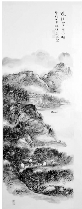
林小康 《皖江山水》2023年