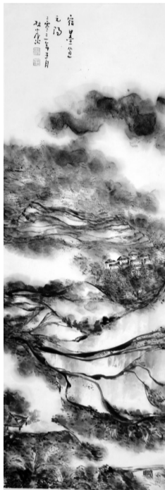
林小康 《宿墨画元阳》2021年