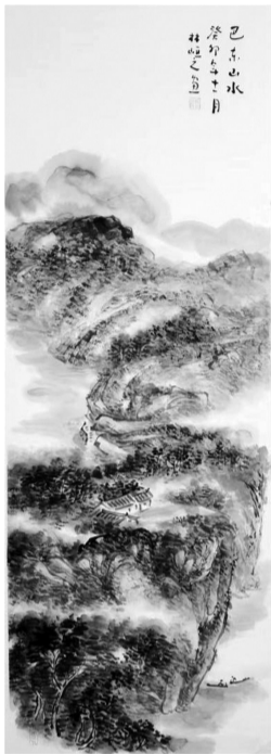
林小康 《巴东山水》2023年