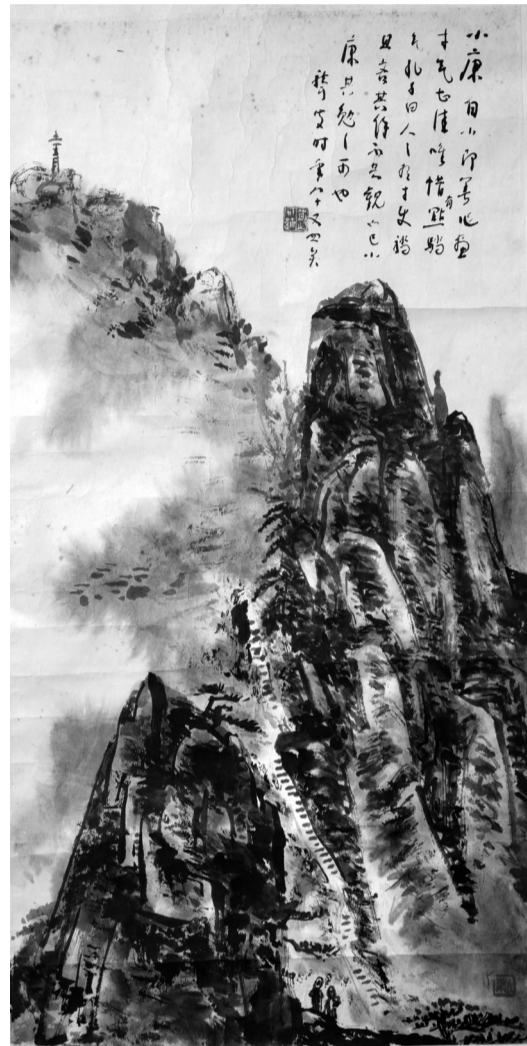
林小康《黄山图》1981年 《林散之三代山水画展》参展作品