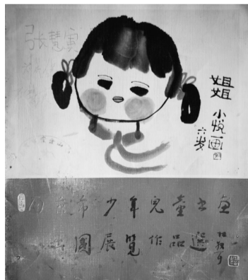
《南京市少年儿童书画出国展览作品选》南京市少年儿童书画工作者协会编 1982年

家联合举办《林散之三代山水画展》，在鼓楼公园“艺术作品展览馆”展出。此次三代画展小康共展出16幅作品，其中最受关注的是一幅《黄山图》，此图笔墨干净，气韵浑厚，画面上还有他爷爷题写的一段话：“小康自小即善作画，才气甚佳，唯惜有点骄气。孔子曰：人之有才，使骄且吝，其余不足观也已。小康其勉之可也。耄叟时年八十四矣。”展览后某日，林老在家与长女林荪若、长子林筱之和孙子小康共同切磋画艺，合作绘成一幅《江上清风》图。林老在题跋中记述，此画经过女儿荪若、儿子筱之、孙子小康的讨论，大家各抒己见，发表看法，一致认为作画以勾勒为主，笔墨宜求干湿浓淡之变化，气韵自生，天趣乃成，方为佳构。文字虽简，却可以想见当年一个和谐融洽的家庭里老幼三代艺人共研绘事的场景。小康得到爷爷的教导，更加沉下心来，刻苦地练习书法，追摹宋元诸名家的画，在笔墨和章法上有了新的领悟。