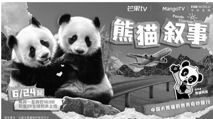
《熊猫叙事》