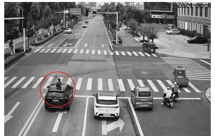
等红绿灯时,男孩爬上车顶

现代快报讯(通讯员 洪桂兵 记者 毛晓华)近日,泰州泰兴路上发生惊魂一幕,一辆正在行驶的汽车上,一个小男孩通过天窗爬上车顶,双手紧紧抓着天窗边缘。不可思议的是,孩子父亲没有停车,反而继续行驶。现代快报记者获悉,交警巡查发现后,拨打驾驶员电话,要求其立刻停车将孩子安全接下车。