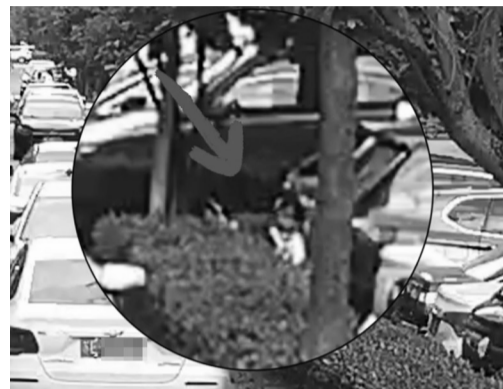
公共视频中，小女孩一闪而过的身影

现代快报讯(记者 高达)日前，苏州市吴江区公安局开发区派出所接到一市民报警：其6岁的女儿在小区里凭空“消失”了。民警赶到现场后和群众一同寻找了两个小时，最后发现女孩在停车场一辆汽车的车底呼呼大睡。