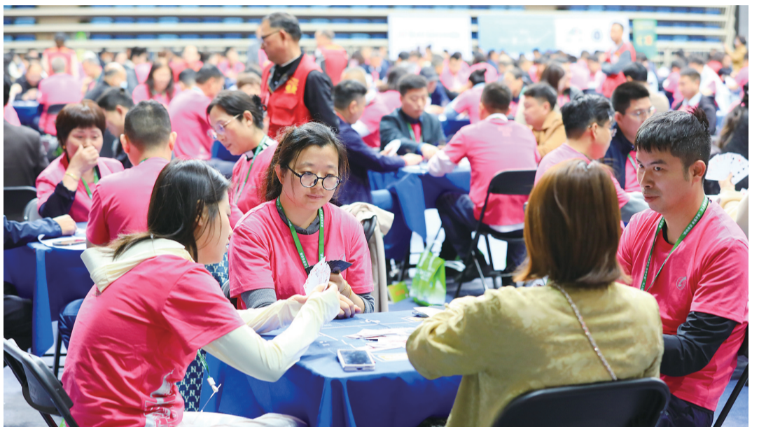
今年5月在淮安市体育中心举行的攒蛋扑克牌精英赛，吸引了全国上万名选手参加