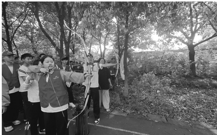
魏村中学小记者开展射箭运动体验

这与做事成功的道理颇为相似。许多人常将自己的失败归咎于某个看似简单的原因,并认为只要克服这个原因就能成功。然而,事