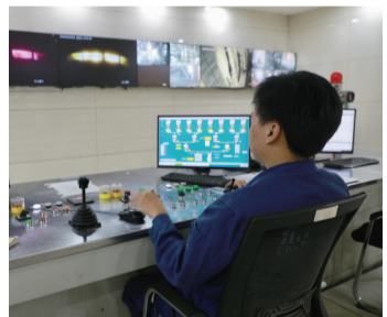
动动指尖就可炼钢