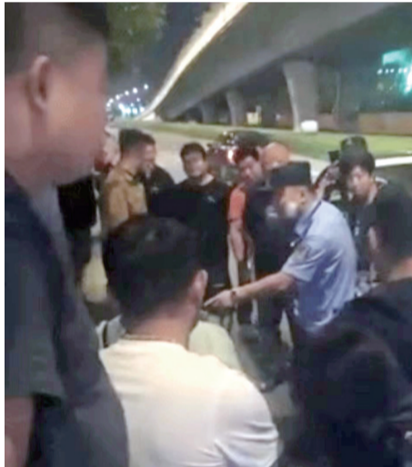
民警告知驾驶人所触犯的法律法规