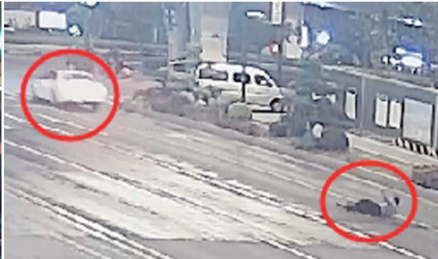
民警双手脱离车门框摔倒在路面