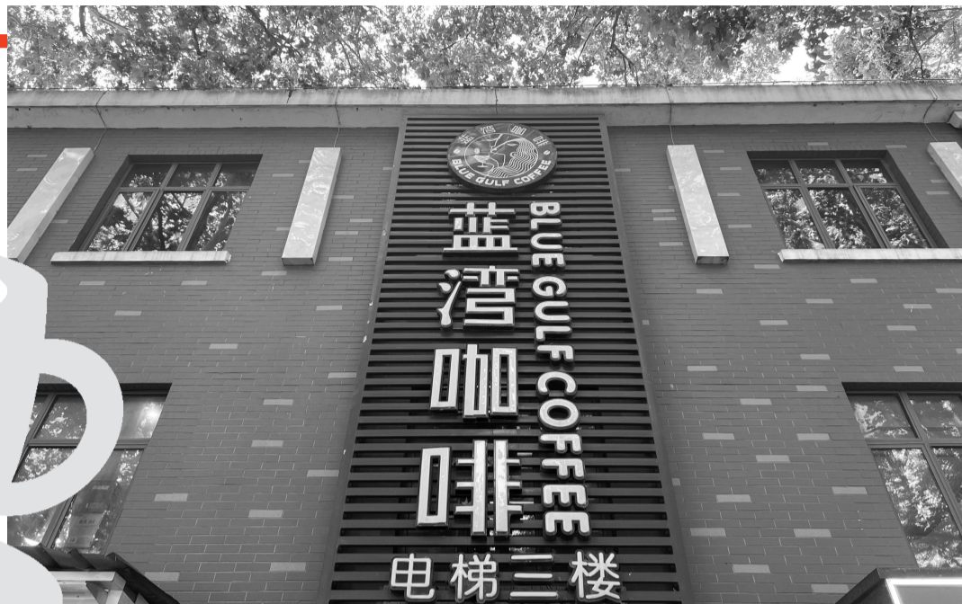
蓝湾咖啡中山门店