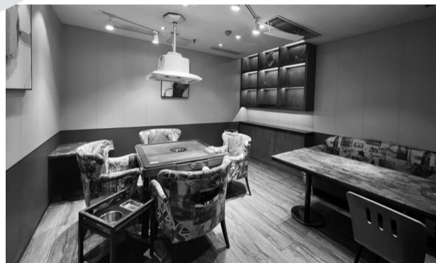
蓝湾咖啡元通店包间