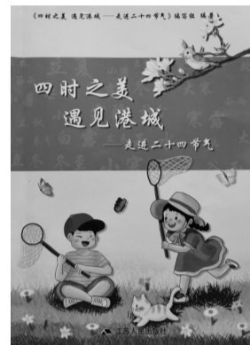
《四时之美，遇见港城》编写组 编著 江苏人民出版社 2023年6月

“春雨惊春清谷天，夏满芒夏暑相连，秋处露秋寒霜降，冬雪雪冬小大寒。”从春雨潇潇到冬雪飘飘，我们的祖先通过观察太阳周年运动，参照天象、气象和物象等自然现象，总结出一年之中自然界时令、气候等方面的变化规律，形成了二十四节气的时间知识体系，深度融入了人们的生产和生活之中。由连云港市委宣传部组织策划、指导创编的《四时之美，遇见港城——走进二十四节气》一书，以当代的审美视角，新颖的框架结构，独特的表现方式，生动的语言叙事，精美的手绘插图，一如盎然诗意拂面而来，不仅给人以广博的自然、人文知识，而且更给人一种美的享受，深得广大读者特别是青少年朋友的钟情与喜爱。