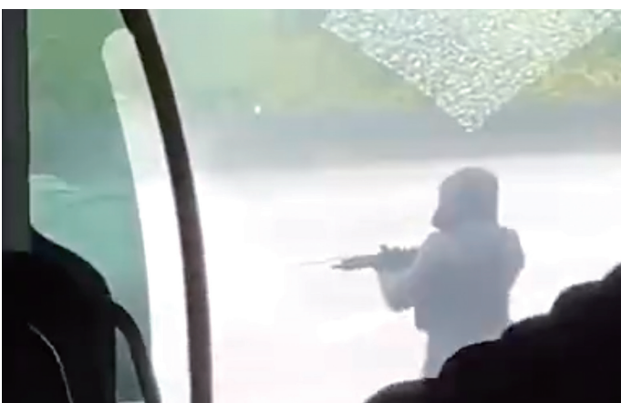
犯罪现场视频截图

这次事件在法国引起了巨大震动,法国国民议会为了纪念在执行职责时遇害的公务员,进行了一分钟的默哀。国民议会主席雅尔·布朗·皮维特在议会上表示:“这次犯罪袭击的肇事者不应逍遥法外。”她详细说明了这次袭击的情况:“囚车遭到了重型武器