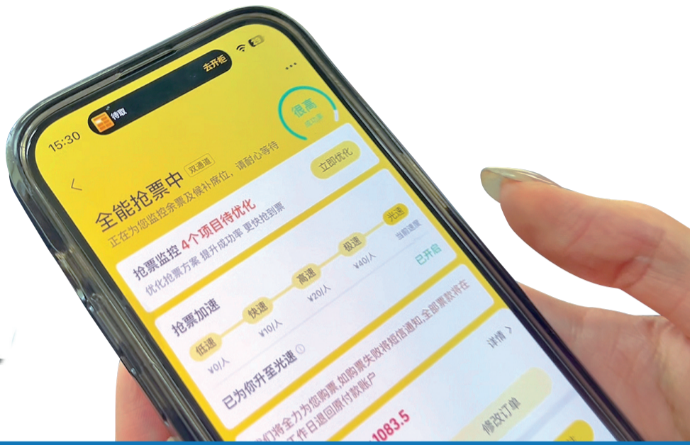
第三方抢票软件提速有等级