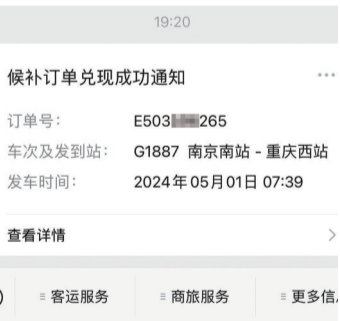
记者G通过铁路12306抢票成功

4月24日15:20，4名记者通过铁路12306App分别候补购买4月30日南京到西安G360次、4月30日南京到南昌G1503次、5月1日南京到长沙G1545次、5月1日南京到重庆G1887次的高铁二等座车票。10分钟后，另外4名记者分